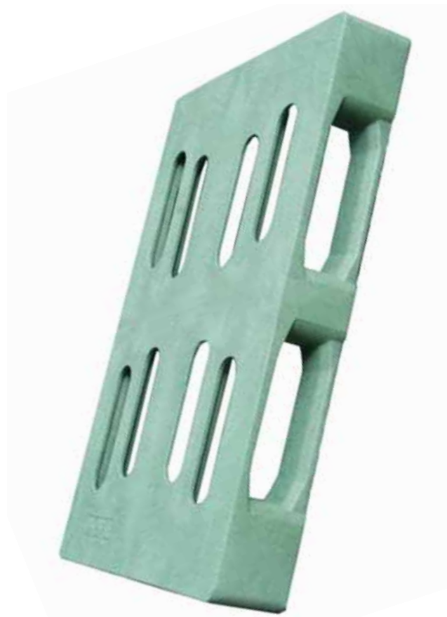
Euromaß: 1.200 x 800 mm